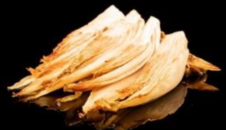
317 INSALATA BELGA ALLA GRIGLIA: Belga grigliata.