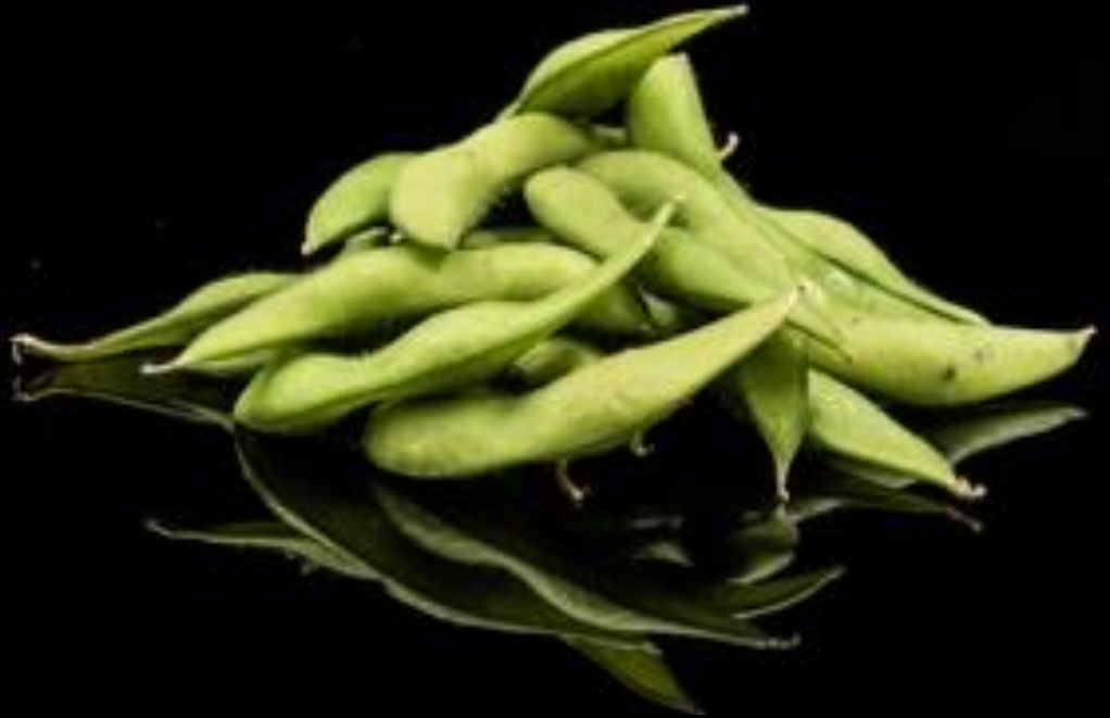
12 EDAMAME: Bacelli di soia bollite.