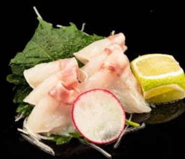
70 SASHIMI DI BRANZINO 6pz: