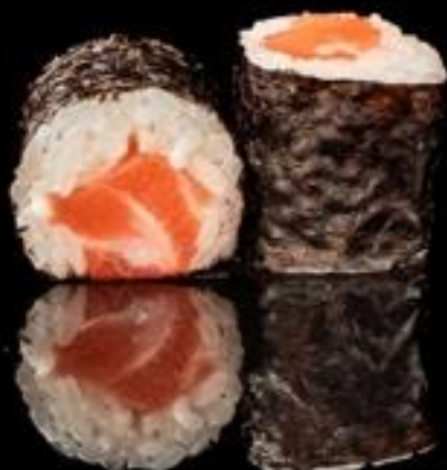
145 HOSO SALMONE 6pz: Rotoli piccoli di riso avvolti con alga nori con interno salmone.