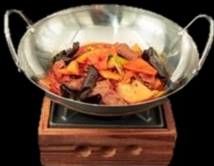
293 PADELLA MANZO:

Piatto tradizionale di carne di manzo e verdure, servito al tavolo nel wok con fornello.