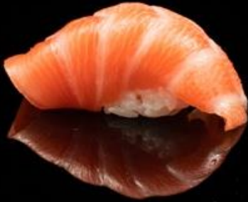
80 NIGIRI SALMONE 2pz: