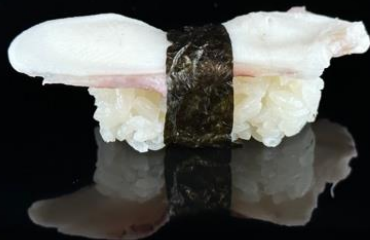
89 NIGIRI POLIPO 2pz:

Bocconcini di riso con polipo, alga nori e teriyaki.