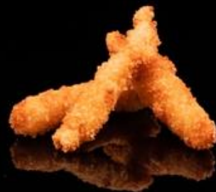
303 POLLO FRITTO: