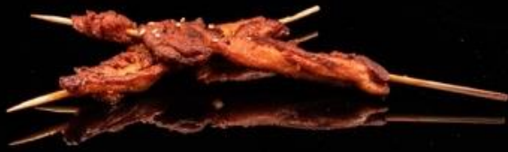
310 SPIEDINI DI POLLO 2pz: Spiedini di pollo brasato alla piastra.