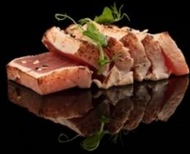
76 TATAKI TONNO 6pz:

Fette di tonno scottato con sesamo e salsa teriyaki.