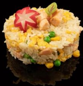
243 RISO SALMONE:

Riso saltato con salmone, verdure miste e uova.