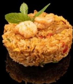
242 RISO THAI:

Riso saltato con gamberi, pollo, verdure miste e uova.