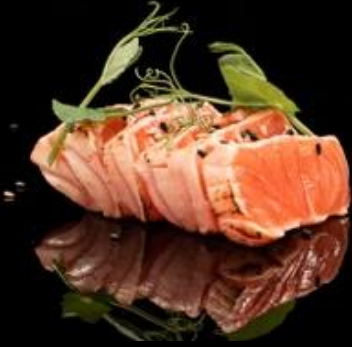
75 TATAKI SALMONE 6pz:

È possibile ordinare solo 1 volta i piatti numero 75-76