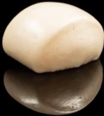
30 BAO 2pz: