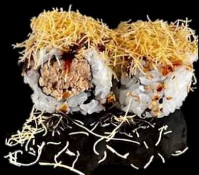
204 URA MULA 4pz:

Roll di riso con sesamo, salmone scottato, interno salmone cotto, pasta kataifi e salsa teriyaki.