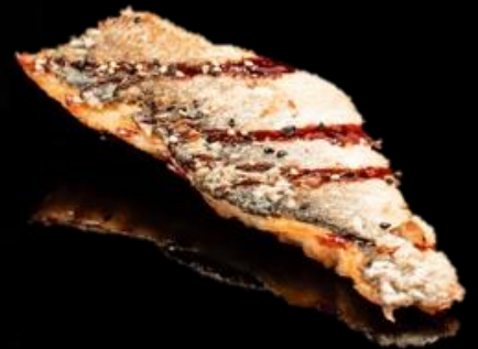
314 BRANZINO ALLA GRIGLIA 1pz: Branzino alla griglia con sesamo e salsa teriyaki.