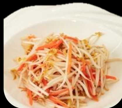
292 GERMOIA DI SOIA: