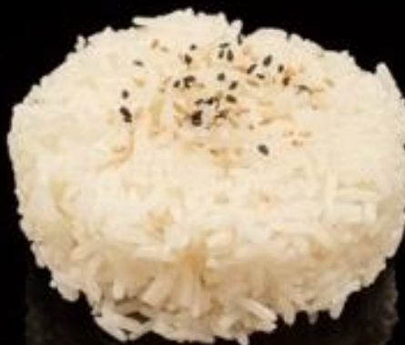
237 RISO BIANCO: Riso bianco con sesamO