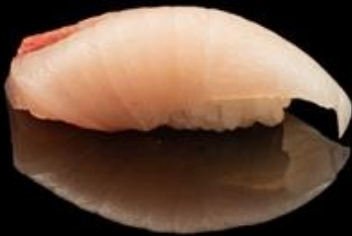
83 NIGIRI RICCIOLA 2pz: