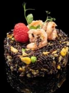
244 RISO VENERE:

Riso saltato con gamberi,uova e verdure miste.