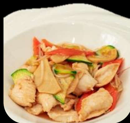
278 POLLO VERDURE:

Petto di pollo saltato con verdure miste.