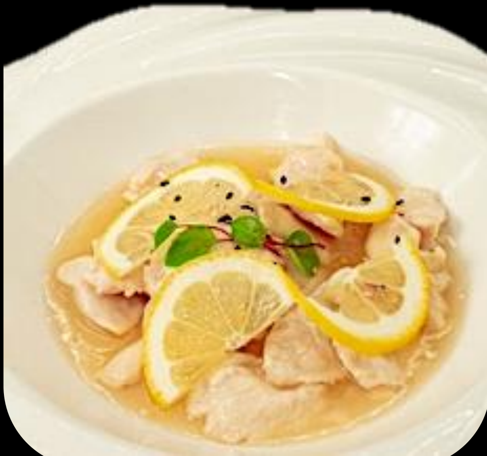
277 POLLO LIMONE:

Petto di pollo saltato con salsa al limone.