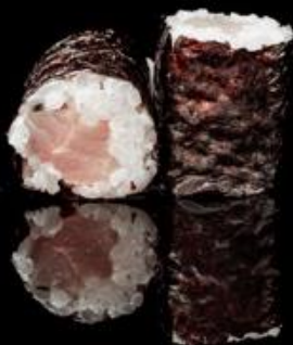
147 HOSO BRANZINO 6pz: Rotoli piccoli di riso avvolti con alga nori con interno branzino.