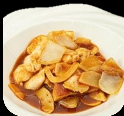
279 POLLO CURRY:

Pollo saltati con fette di patate e curry.