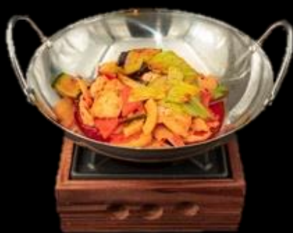
295 PADELLA POLLO:

Piatto tradizionale di carne di pollo e verdure, servito al tavolo nel wok con fornello.