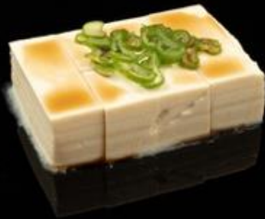
11 TOFU: Tofu con salsa di soia.