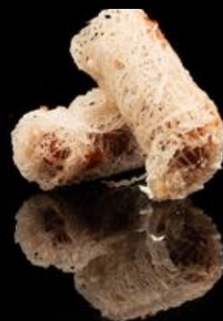
3 INVOLTINO PATATE VIOLA 2pz:

involtino fritto di pasta sfoglia con ripieno patate viola.