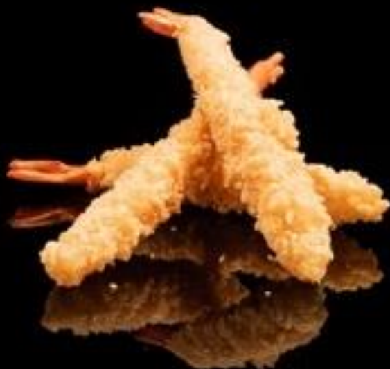
300 EBI TEMPURA 3pz: