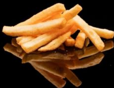
4 PATATINE FRITTE: