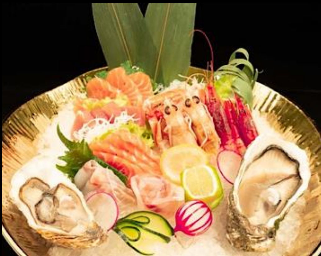
73 SASHIMI ULTRA 24pz:

Fette di pesce misto, gambero rosso, scampi e ostriche.