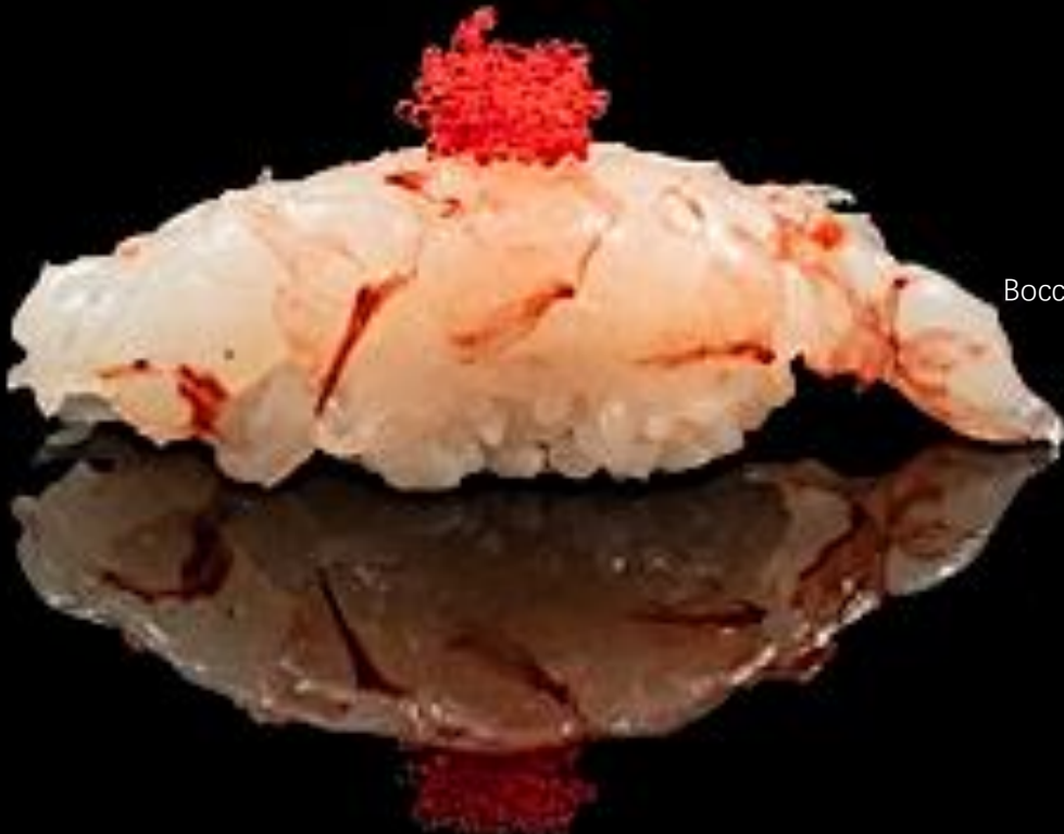
86 NIGIRI AMAEBI 2pz:

Bocconcini di riso con amaebi e uova di lampo.