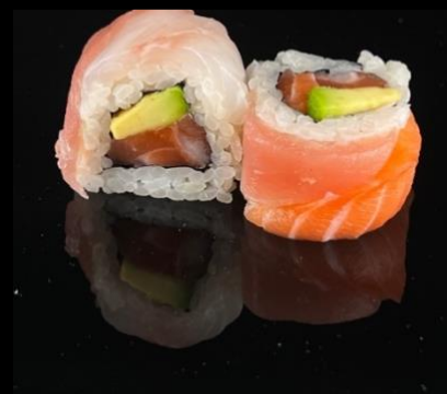
206 URA RAINBOW 4pz:

Roll di riso con sesamo, fette di pesce misto, interno salmone e avocado.