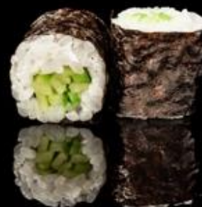
149 HOSO CETRIOLI 6pz (4€): Rotoli piccoli di riso avvolti con alga nori con interno cetrioli.