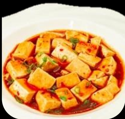
290 TOFU MAPO: