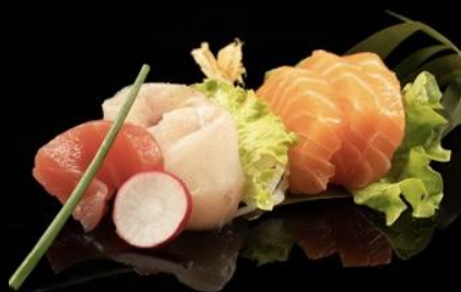
71 SASHIMI MISTO 8pz: