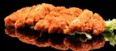
306 COTOLETTA DI MAIALE: