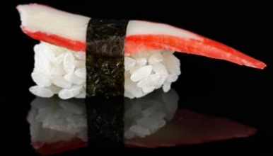
88 NIGIRI SURINI 2pz:

Bocconcini di riso con surini e alga nori.