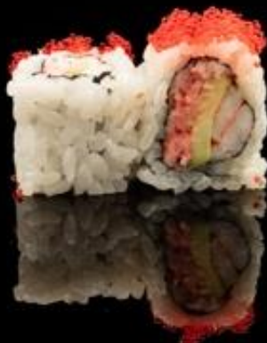
205 URA CALIFORNIA 4pz:

Roll di riso con sesamo, tobico, interno surimi avocado, cetriolie maionese.