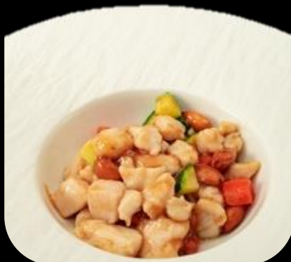
281 POLLO MANDORLE:

Pollo saltato con mandorle e verdure miste.