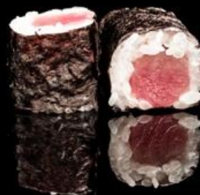
146 HOSO TONNO 6pz: Rotoli piccoli di riso avvolti con alga nori con interno tonno.