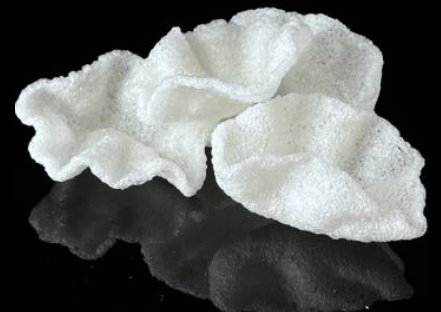
14 NUVOLETTE DI DRAGO: croccanti chips di tapioca e frutti di mare.