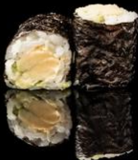
150 HOSO AVOCADO 6pz: Rotoli piccoli di riso avvolti con alga nori con interno avocado.