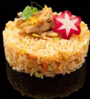
240 RISO POLLO: Riso saltato con pollo, verdure miste e uova