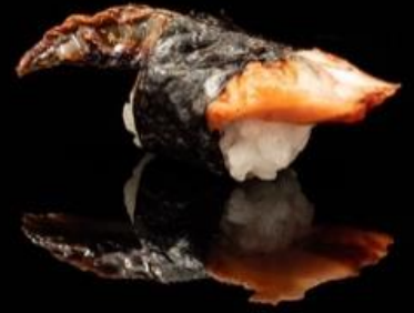
87 NIGIRI ANGUILLA 2pz: Bocconcini di riso con anguilla e alga nori.