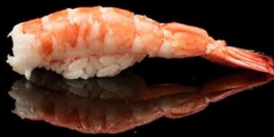
84 NIGIRI GAMBERO COTTO 2pz: