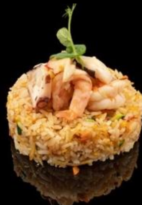
241 RISO FRUITI DI MARE: Riso saltato con frutti di mare, verdure miste e uova