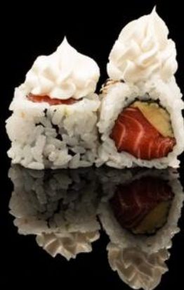
202 URA PHILADELPHIA 4pz:

Roll di riso con sesamo, philadelphia, interno salmone e avocado.