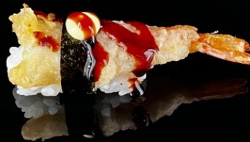
90 NIGIRI GAMBERO FRITTO 2pz:

Bocconcini di riso con gambero fritto, alghe nori e teriyaki.