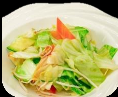
291 VERDURE MISTE: