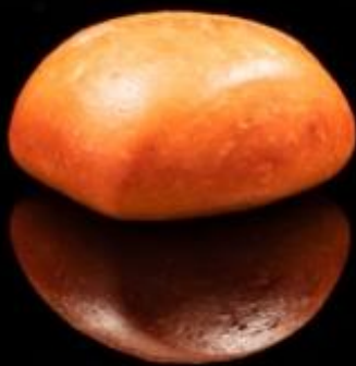
31 FRITTO BAO 2pz: