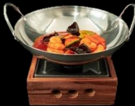
294 PADELLA GAMBERI:

Piatto tradizionale di gamberi e verdure, servito al tavolo nel wok con fornello.