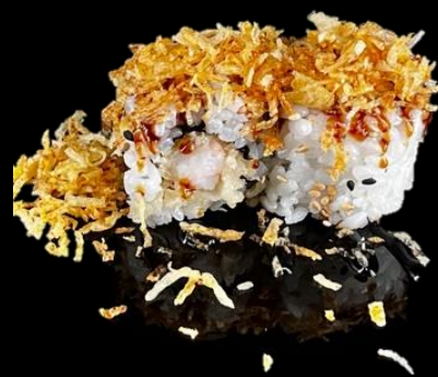
203 URA EBITEN 4pz:

Roll di riso con sesamo, patatine fritte, interno gambero fritto, maionese e salsa teriyaki.