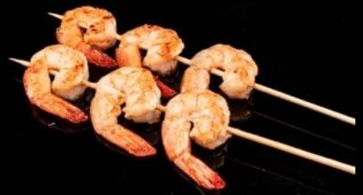
311 SPIEDINI DI GAMBERI 2pz: Spiedini di gamberetti alla griglia.