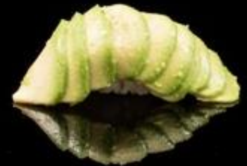
85 NIGIRI AVOCADO 2pz: