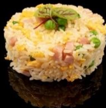
238 RISO ALLA CANTONESE: Riso saltato con piselli, prosciutto cotto e uova.