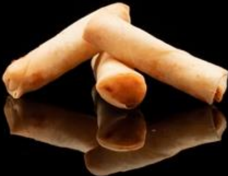
1 INVOLTINO PRIMAVERA 2pz:

Involtino fritto di pasta sfoglia ripieno di verdure.