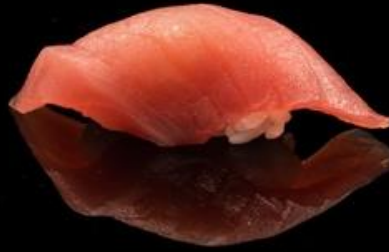
81 NIGIRI TONNO 2pz: