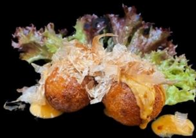
5 POLPETTE DI CALAMARI 2pz:

Polpette di grano fritto con polipo all'interno con top scaglie di bonito.