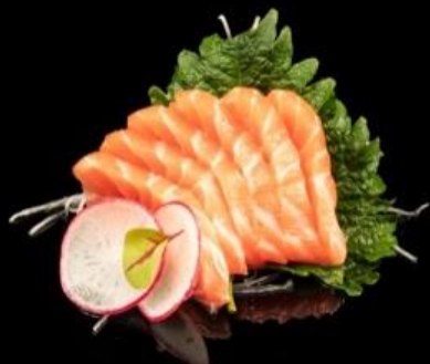
68 SASHIMI SALMONE 6pz:

È possibile ordinare solo 1 volta i piatti numero 69-70-71-72-73