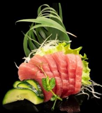
69 SASHIMI DI TONNO 6pz: