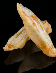
6 FIORE DI ZUCCA AL PROSCIUTTO