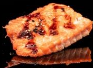
313 SALMONE ALLA GRIGLIA 1pz: Salmone alla griglia con sesamo e salsa teriyaki.