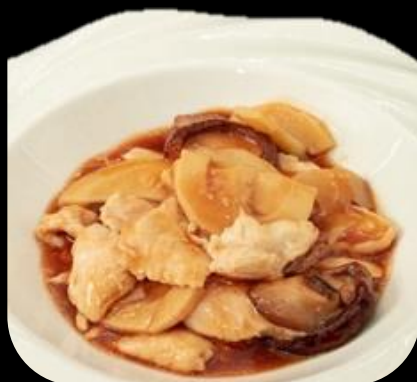
280 POLLO FUNGHI E BAMBU: