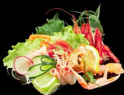
72 SASHIMI MISTO PLUS 12pz:

Fette di pesce misto, gambero rosso e scampi.