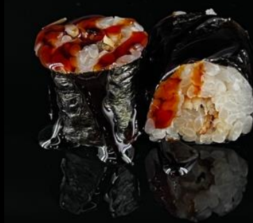
151 HOSO ANQUILLA 6pz: Rotoli piccoli di riso avvolti con alga nori con interno anquilla e teriyaki.