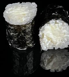
152 HOSO PHILADELPHIA 6pz: Rotoli piccoli di riso avvolti con alga nori con interno philadelphia.