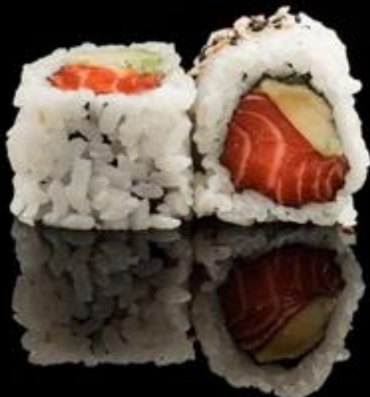
200 URA SALMONE AVOCADO 4pz:

Roll di riso con sesamo e interno salmone e avocado.