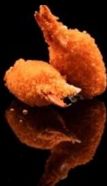
304 CHELE DI GRANCHIO 2pz:

Crocante frittura di chele di granchio impanate.