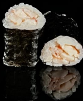
148 HOSO GAMBERO COTTO 6pz: Rotoli piccoli di riso avvolti con alga nori con interno gambero cotto.