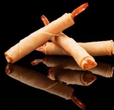
2 INVOLTINO GAMBERO 2pz:

Involtino fritto di pasta sfoglia con ripieno di gambero.