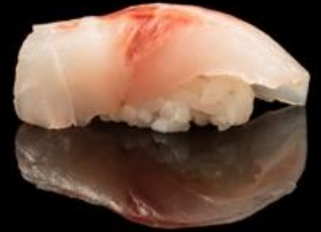
82 NIGIRI BRANZINO 2pz: