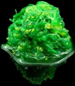
10 GOMA WAKAME: Alghe agropicanti.