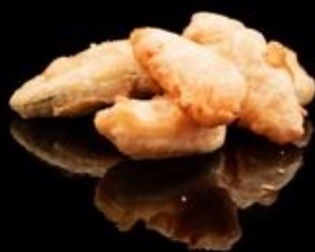
302 TEMPURA VEGETARIANO 3pz: