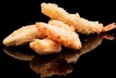
301 TEMPURA MIX 3pz: