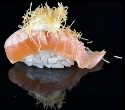
91 NIGIRI SALMONE PHILADELPHIA 2pz:

Bocconcini di riso con salmone scottato con top philadelphia e kataifi.