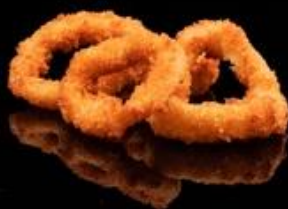
305 CALAMARI FRITTI 4pz: