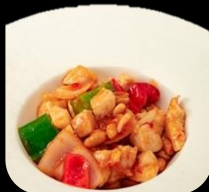
282 POLLO PICCANTE:

Pollo saltato con peperoncino e cipolla.