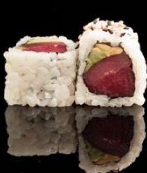
201 URA TONNO AVOCADO 4pz:

Roll di riso con sesamo, interno tonno e avocado.