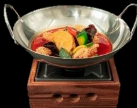
296 PADELLA CALAMARI:

Piatto tradizionale di calamari e verdure, servito al tavolo nel wok con fornello.