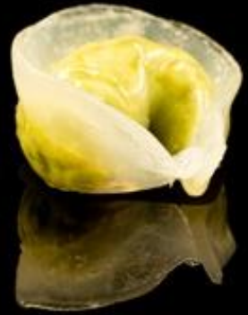
25 RAVIOLI EDAMAME 3pz:

Ravioli cotti al vapore con ripieno di edamame.