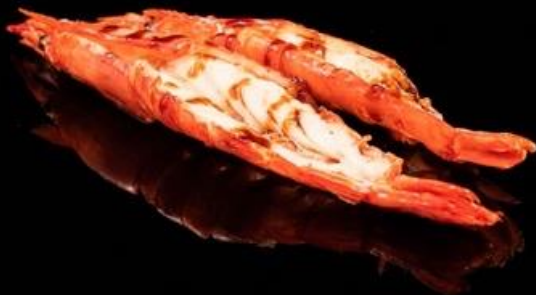
312 GAMBERONI ALLA PIASTRA 2pz: Gamberoni alla griglia con sesamo e salsa teriyaki.