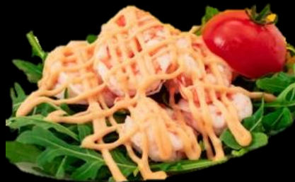
13 COCKTAIL DI GAMBERI: Gamberetti e rucola con salsa rosa.