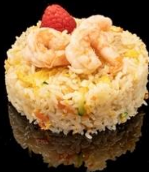
239 RISO GAMBERI: Riso saltato con gamberi, verdure miste e uova.