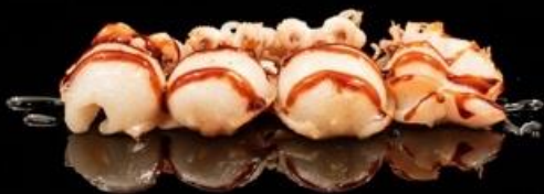
315 CALAMARI ALLA GRIGLIA 2pz: Calamaro alla griglia con sesamo e salsa.